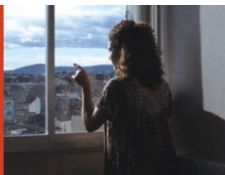
Lydia di Anita Lewton-Moukkes Francia, 2016, 12'