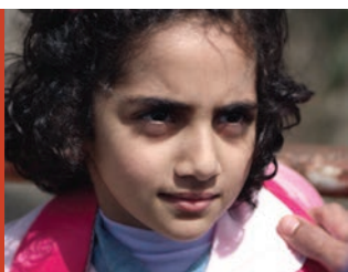
Behind the Wall di Karima Zoubir Marocco, 2016, 18'.