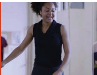
Joy di Daniele Gaglianone Italia, 2017, 17'.