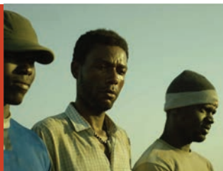
Jululu di Michele Cinque Italia, 2017, 15'.