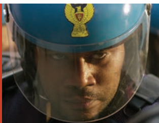
Il legionario di Hleb Papou Italia, 2017, 13'.