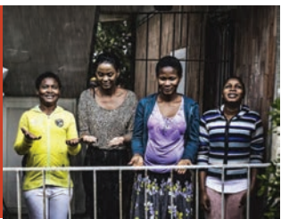
Piove di Ciro D'Emilio Italia, 2017, 7'.