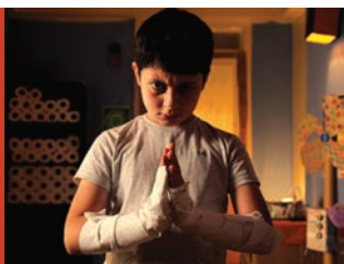
Yaman di Amer Albarzawi Siria, 2016, 4'